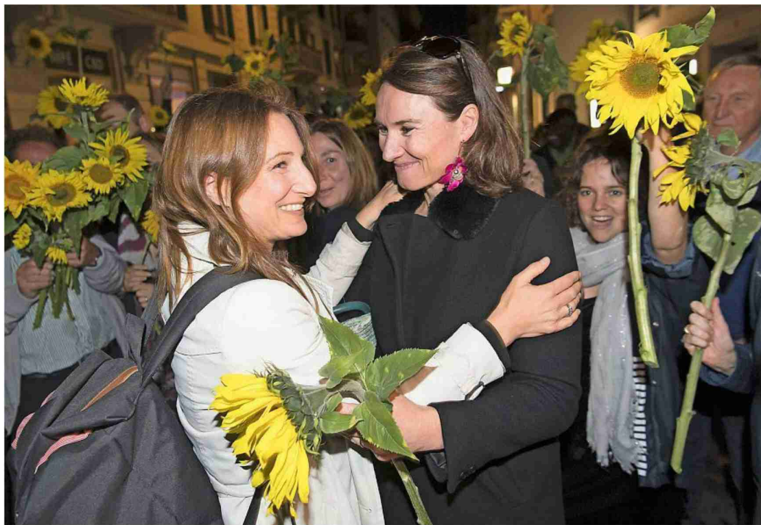
Siegerinnen unter sich: die Grünen Adele Thorens Goumaz (l.) und Sophie Michaud Gigon (r.).

Referenz: 75189106 Ausschnitt Seite: 3/3