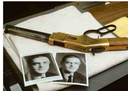
Per Zufall darauf gestossen: Die Tatwaffe im Fall Seewen.

Es gilt als grösstes ungeklärtes Verbrechen der neueren Schweizer Kriminalgeschichte. 1976 werden im Ferienhaus Waldeggli bei Seewen SO fünf Menschen mit einer Winchester-Replika erschossen. Erst vier Tage später entdeckt eine Passantin die Leichen. Das Motiv ist unklar. Die Polizei tappt 20 Jahre lang im Dunkeln, bis ein Handwerker in Olten per Zufall die Tatwaffe entdeckt. Sie ist hinter einer Küchenabdeckung versteckt, fein säuberlich in Plastik eingepackt. Dabei ist der Pass eines Carl Doser. Doser aber verschwand 1977 spurlos. Der Fall ist verjährt. (lia)