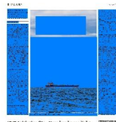
SP-Initiative für «Kranke-Lose-Igler»