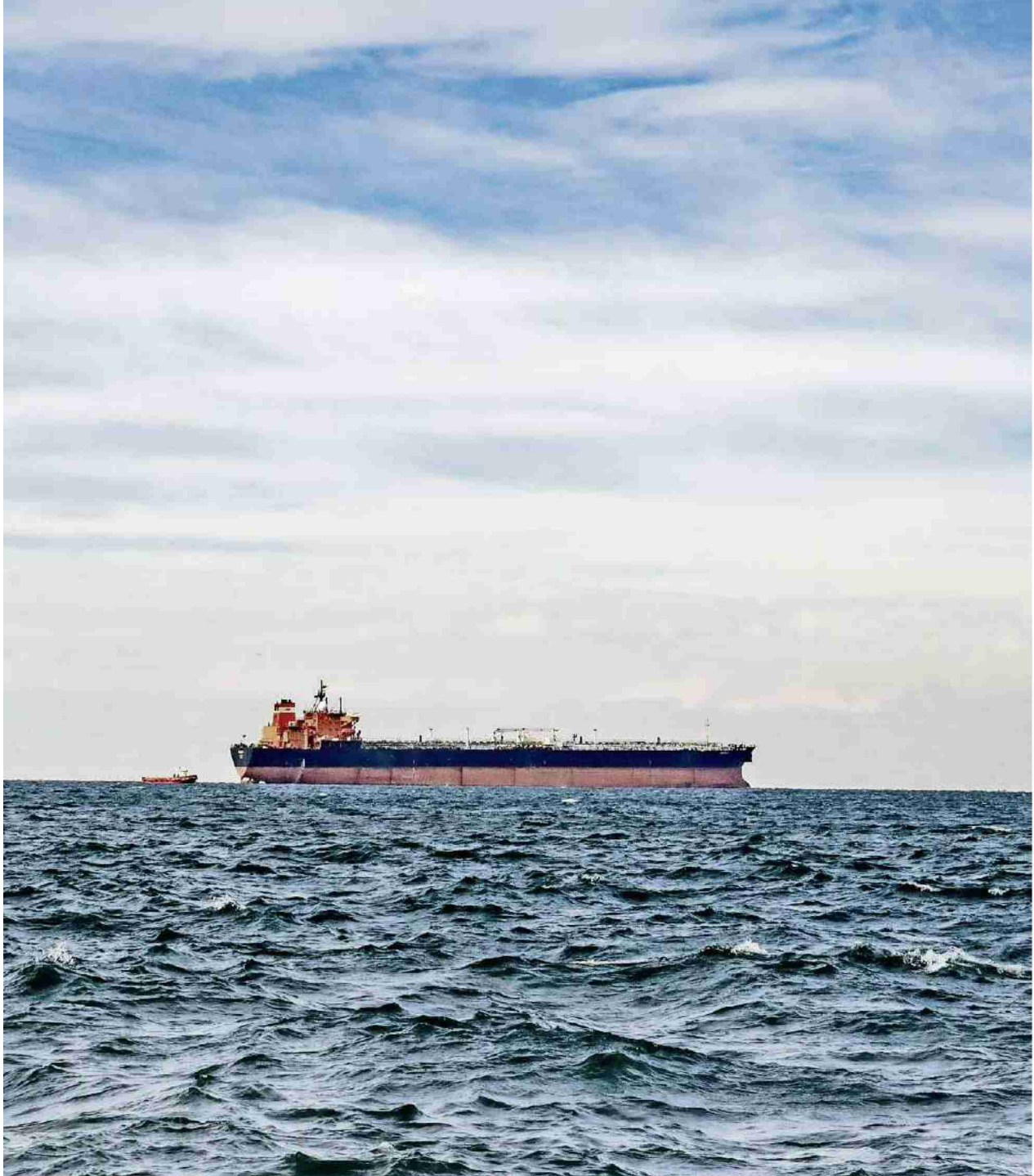
Kamen den Bund teuer zu stehen: Frachter auf hoher See.

Referenz: 74043919 Ausschnitt Seite: 3/3