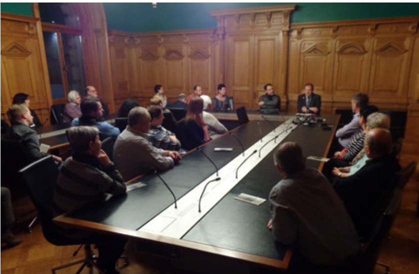
Die Mitglieder der FDP Knutwil-St. Erhard im Kommissionszimmer Nr. 4