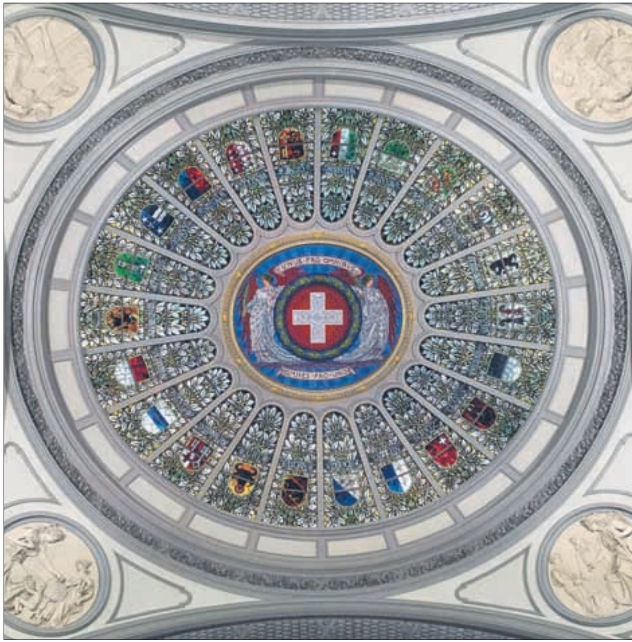
Die Glaskuppel des Bundeshauses in Bern mit den Kantonswappen.

Ein Grundproblem des NFA ist, dass Empfängerkantone heute wenig Anreiz haben, sich von den Ausgleichszahlungen unabhängig zu machen. Die sogenannte Grenzabschöpfungsquote liegt im Schnitt bei 79 Prozent, wie der Bundesrat in seinem im März publizierten Wirkungsbericht festhält. In der Praxis bedeutet das: Vermag ein Kanton seine Finanzkraft um 1 Franken zu erhöhen, verliert er davon 79 Rappen in Form von tieferen Einnahmen aus dem Finanzausgleich.